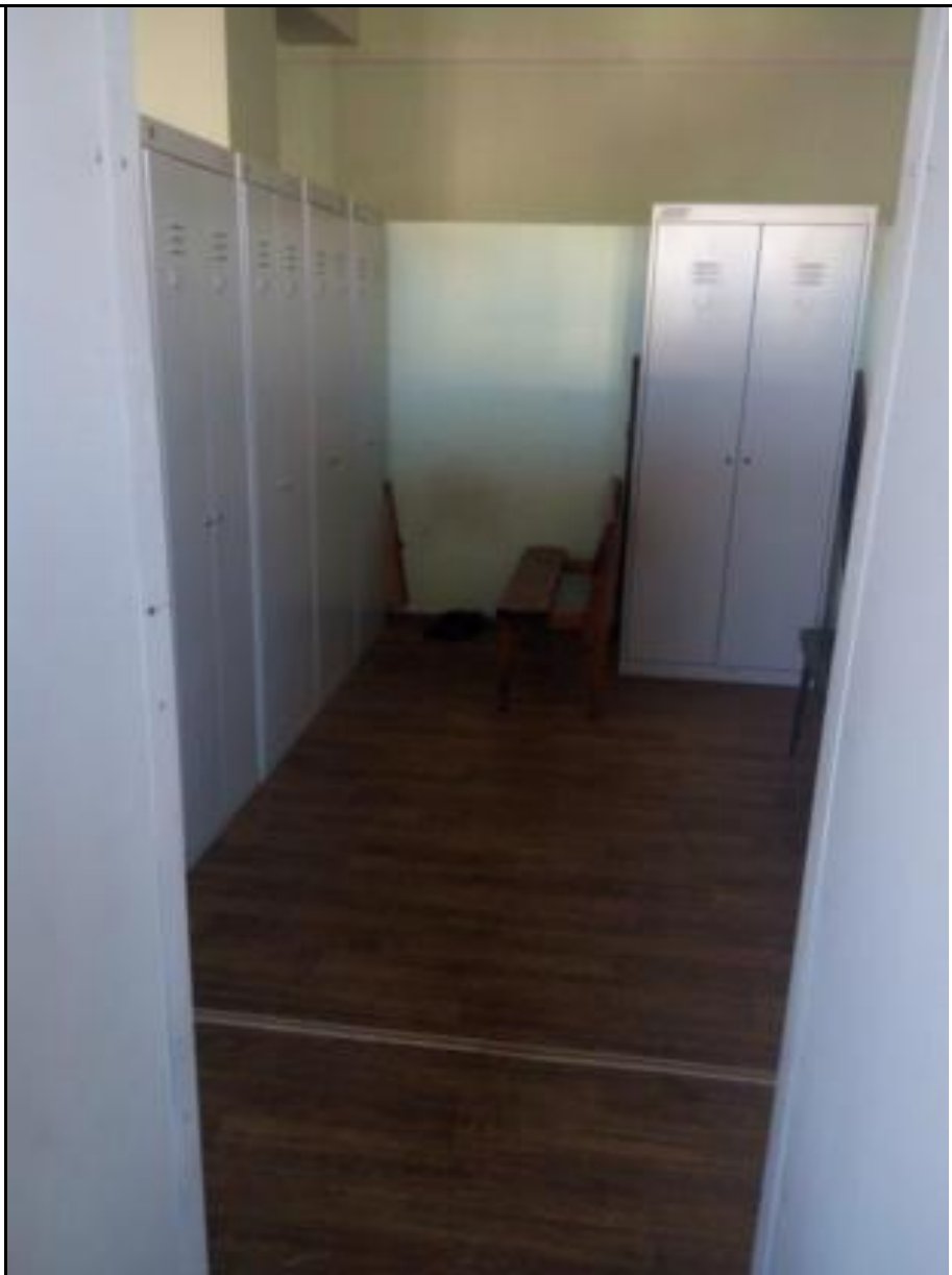
Часть помещения № 37