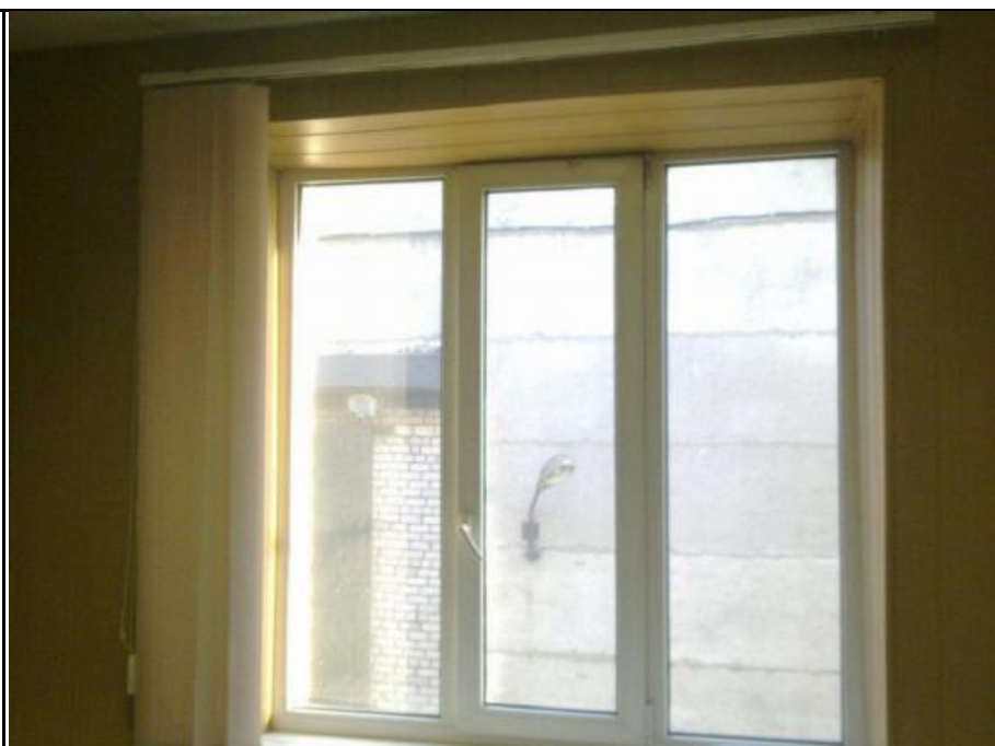
каб 12 на 2 этаже 21.8 кв.м