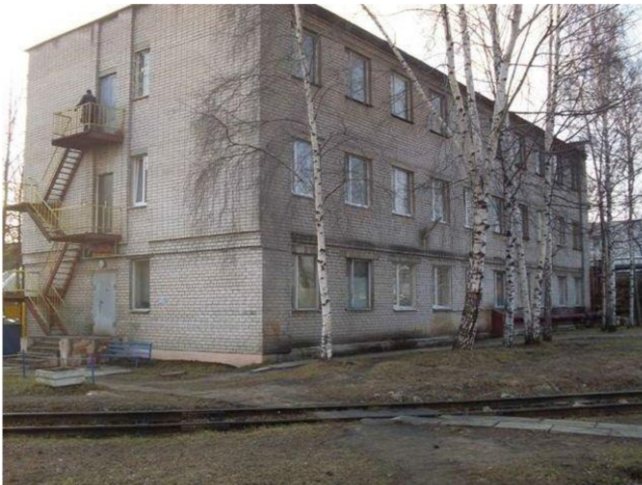
Схема здания служебно-бытового корпуса, расположенного по адресу: г.Тверь, ул.Железнодорожников, д.30 по лоту №5

Существующие ограничения (обременения) права: не зарегистрированы